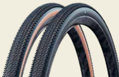
G-One R Pro: Allrounder, schnell auf Asphalt, aber auch gut im Gelände.