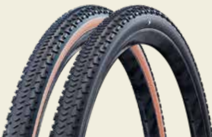
G-One RX Pro: Fokus auf Offroad-Einsatz mit mehr Grip unter schwierigen Bedingungen.