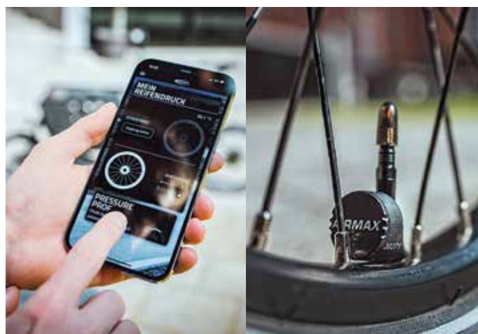
App und Sensor liefern alle wichtigen Informationen auf einen Blick: aktueller Reifendruck vorn und hinten, Temperatur und Batteriestatus.

Praktisch: Der optimale Reifendruck lässt sich in der App über den Pressure Guide berechnen. Dort werden alle wichtigen Informationen gezeigt: Der aktuelle Reifendruck im Vorder- und Hinterrad inklusive Reifendruckstatus, Temperatur und Batteriestatus.