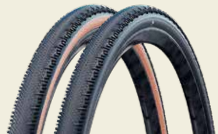
G-One RS Pro: Beste Wahl für Asphalt und harten Schotter. Fokus auf maximale Geschwindigkeit.