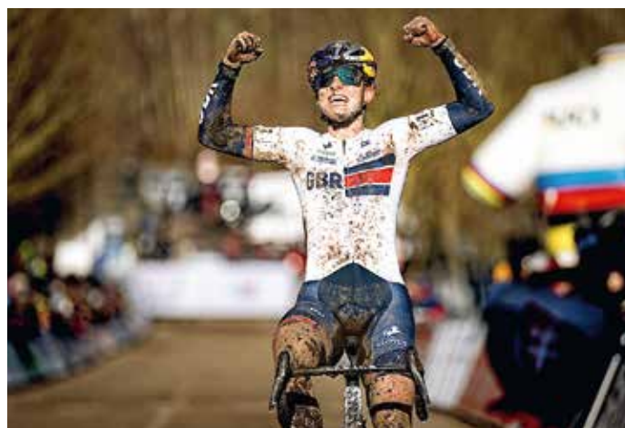
Zoe Bäckstedt gewinnt das erste WM-Gold auf Tubeless- Reifen im Cyclocross.