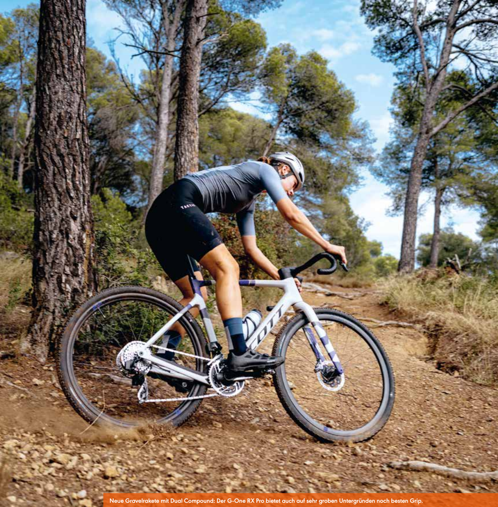
Neue Gravelrakete mit Dual Compound: Der G-One RX Pro bietet auch auf sehr groben Untergründen noch besten Grip.