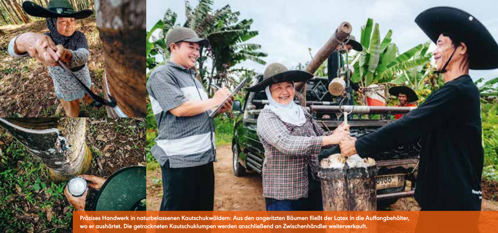
Präzises Handwerk in naturbelassenen Kautschukwäldern: Aus den angeritzten Bäumen fließt der Latex in die Auffangbehälter, wo er aushärtet. Die getrockneten Kautschuklumpen werden anschließend an Zwischenhändler weiterverkauft.

UNTERNEHMEN / Bereits ein Drittel des Schwalbe-Sortiments wird mit fair gehandeltem Naturkautschuk hergestellt. Das Ziel: 100 Prozent im Jahr 2035.