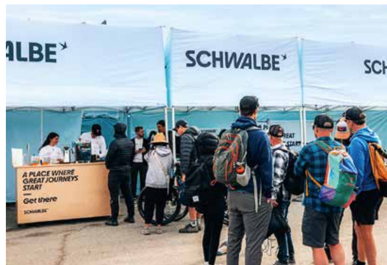
Das Sea Otter Classic in Kalifornien ist Festival und Industriemesse zugleich. Begeht bei Schwalbe: Die Neuheiten und der technische Support.