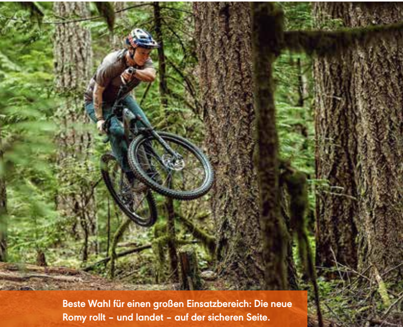
Beste Wahl für einen großen Einsatzbereich: Die neue Romy rollt – und landet – auf der sicheren Seite.

Eine weitere Neuheit: Die drei Familien-Namen entsprechen nun auch den Karkassen-Konstruktionen, die Schwalbe von fünf auf drei reduziert hat (siehe Tabelle unten).